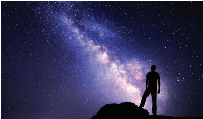
Slika 1 – Mliječna staza

Kad ste posljednji put ponosno dignuli pogled prema nebu i vidjeli noćno nebo u svoj njegovoj osebujnoj raskoši?! Maštali pogledom prema tamnom, mračnom platnu načičkanom milijunima zvijezda, takvog reflektirajućeg sjaja da vam se čini da zvijezde možete dotaknuti?! Kad ste prebirući pogledom po nebu ugledali Mliječnu stazu , našu galaktiku (slika 1)?!