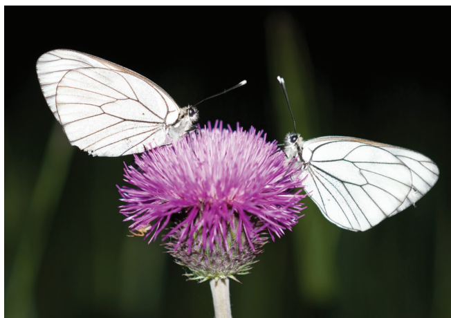
Slika 4 – Mehki čičak (lat. Cirsium oleraceum ); Umjetna rasvjeta isključuje noćne oprašivače

Kad promatramo svjetlosno onečišćenje često zanemarujemo biljke jer se za njih smatra da im je dodatna svjetlost potrebna zbog procesa fotosinteze. No zbog svjetlosnog onečišćenja biljke prekomjerno i prebrzo rastu, bujaju i invazivne vrste (slika 4). Problem s tim imaju i poljoprivrednici koji su primorani povećati troškove za otklanjanje nepoželjnih vrsta biljaka i zaraslih područja. Nadalje, zbog konstantnog osvjetljenja sve više biljaka i stabala cvjeta u neočekivano godišnje doba što rezultira gubitkom oprašivača (slika 4), smanjenjem uroda ili nestankom određenih vrsta bilja. 9 Neke vrste biljaka cvatu samo noću no zbog svjetlosnog