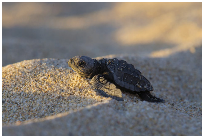
Slika 3 – Kretanje kornjače prema umjetnoj rasvjeti

Promatramo li ptice selice uočavamo da prilikom selidbe gube orijentaciju. Također, brojne ptice izbjegavaju raditi gnijezda na osvijetljenim mjestima, jer ih čine ranjivijim pred grabežljivcima. 6 Morske kornjače (slika 3) su uz ptice jedne od većih žrtava svjetlosnog onečišćenja. Naime, nakon što se izlegnu, mlade kornjače nastoje ići prema moru, ali zbog odbljeska javne rasvjete često se usmjere prema gradovima te ugibaju. Kukci kao primarna hrana za mnoge ptice i životinje, pogibaju samo u dodiru s izvorom svjetla, čime se narušava hranidbeni lanac životinjskog svijeta. 7 Kod mrava primjećujemo promjenu ponašanja zbog rasvjetljenja tijekom noći koje uzrokuje njihovu povećanu aktivnost. 8