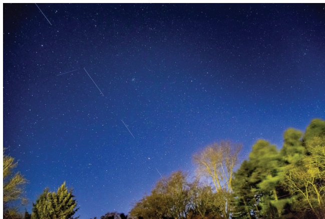
Slika 1 – Tragovi Starlink ovih satelita nad Danskom mjesec dana nakon lansiranja

Posljednjih godina širom svijeta izgrađeno je mnogo opservatorija kojima je ponajprije cilj pronalazak tranzijenata. Posebno važan bit će opservatorij Vera C. Rubin (izvorno nazvan LSST – Large Synoptic Survey Telescope ), daleko najveći širokokutni teleskop s ogledalom promjera osam metara. Opservatorij koji se nalazi u Čileu svakodnevno će otkrivati tisuće tranzijenata. Konstelacije satelita ozbiljno će ugroziti njegov potencijal. Stoga astronomi pokušavaju pregovarati s tvrtkama, dok su velike astronomske