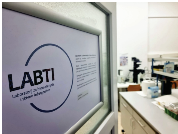
Slika 2 – Novoosnovani Laboratorij za biomaterijale i tkivno inženjerstvo (LABTI)