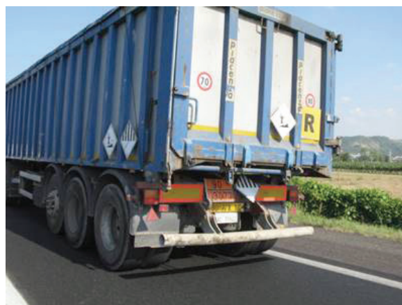
Slika 2 – Prijevoz otpada prema zahtjevima odredbi ADR-a

Na slici 2 prikazan je primjer vozila koje prevozi rasuti teret UN 3077, TVARI OPASNE PO OKOLIŠ, KRUTINE, N.D.N., najvjerojatnije otpad.