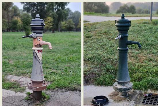
Slika 1 – Pumpa Viktorija zdenac, koju Zagrepčani najčešće zovu Željezni Francek i na kojoj već desetljećima Zagrepčani mogu besplatno popiti vodu izvršne kvalitete.

Na slici su dva zagrebačka Franceka, prvi, ukrašeni, kraj južnog savskog nasipa i drugi, klasične zelene boje, kraj sjevernog nasipa. Jedan od najvažnijih datuma u povijesti Zagreba je 7. srpnja 1878. godine kada je, prema ideji inženjera Melkusa, u rad pušten gradski vodovod. Vodovod se sastojao od zdenca u Zagorskoj ulici, vodospreme u Jurjevskoj ulici, magistralnog i distributivnih cjevovoda od lijevanog željeza, 111 hidranata i 21 zasuna. U odnosu na ostale metropole, Zagreb je gradski vodovod dobio pet godina prije Münchena i samo pet godina nakon Beča. Kapacitet izgrađenog vodovoda bio je 53,2 litre u sekundi, a dužina vodovodne mreže 3,9 km. Zagreb je u to vrijeme imao oko 30 000 stanovnika, a na vodoopskrbnu mrežu bilo je priključeno 11 150 ljudi. Danas je na vodoopskrbnu mrežu priključeno oko 900 000 ljudi, a zanimljivo je napomenuti da je vodosprema u Jurjevskoj ulici i danas u funkciji.