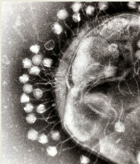
Slika 3 – Transmisijska elektronska mikrofografija više bakteriofaga pričvršćenih na staničnu stijenku bakterije; povećanje je približno 200 000 puta (izvor: https://en.wikipedia.org/wiki/File:Phage.jpg ). Autor: Dr. Graham Beards.

Virus (lat. virus : otrov) je definiran kao nestanični zarazni uzročnik bolesti u ljudi, životinja i biljaka, a još uvijek se raspravlja o temeljnom pitanju može li se klasificirati kao živi organizmi ili ne. Danas je poznato samo 6000 virusa, dok postoji nekoliko milijuna virusnih sojeva. Iznimna raznolikost virusnih populacija povezana je i s problemima s kojima se susrećemo pri iskorjenjivanju virusa i raznim prijetnjama po javno zdravlje. Viruse je posebno teško ukloniti jer se neprestano razvijaju pod pritiskom prirodne selekcije, što im omogućuje da se suprotstave zaštiti koju nude cjepiva ili posebno ciljani lijekovi.