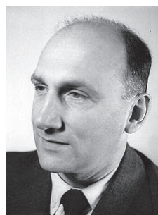
Slika 4 – Vladimir Prelog bio je hrvatski kemičar, dobitnik Nobelove nagrade za kemiju 1975. godine, koji je znatno pridonio razumijevanju stereoizomerije i s britanskim kemičarima R. S. Cahnom i C. K. Ingoldom razvio opći sustav označavanja kiralnih molekula. Kiralnost je svojstvo koje se očituje u nemogućnosti da se tijelo ili molekula poklope s vlastitom zrcalnom slikom. Takav je npr. odnos lijeve i desne ruke, odnosno dlana. U kemiji se kiralnost najčešće odnosi na molekule organskih spojeva koje sadrže asimetrični ugljikov atom kao središte kiralnosti (izvor: https://hr.wikipedia.org/ ).

Kiralni izomeri dva su spoja iste molekularne formule, ali različite prostorne strukture, koje je teško odvojiti i pročistiti zbog gotovo identičnih fizikalnih i kemijskih svojstava. Kiralni spojevi naširoko se upotrebljavaju u lijekovima te kliničkim i drugim područjima. Njihovi različiti enantiomeri imaju vrlo različite farmakološke aktivnosti, metaboličke učinke i toksičnosti, pa čak i suprotne učinke. Većina lijekova koji se svakodnevno upotrebljavaju su kiralni spojevi i postoje u obliku racemičnih smjesa, pa je razdvajanje enantiomera uvijek bilo važno zbog njihovih sličnih kemijskih svojstava, ali različitih farmakoloških aktivnosti. Mnoge klasične tehnologije, poput kiralne sinteze i kromatografskih odvajanja, naširoko su primijenjene za selektivno razdvajanje kiralnih spojeva. Membranski separacijski postupci bez promjene faza i dodataka aditiva, kao