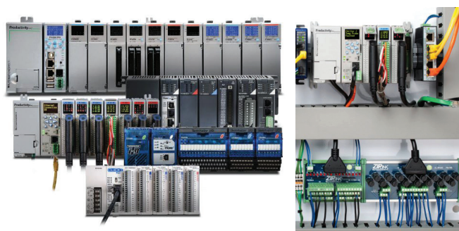
Slika 1 – Sustavi za vođenje