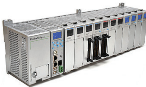
Slika 3 – PAC-ovi su prikladni za sve aplikacije na razini između PLC-a i IPC-a

Napredak PAC-ova izbrisao je granicu između PAC-a i DCS-a. Velik dio funkcionalnosti, moć i integraciju DCS-a danas mogu osigurati proizvođači PAC-ova. Oni su sposobni za napredno vođenje koje je nekad bilo rezervirano za velike DCS-e, a primjeri su modelsko prediktivno vođenje (engl. model predictive control – MPC) i neizrazita logika (engl. fuzzy logic ) koji se primjenjuju za nestabilne ili složene procese kad PID regulacija nije dovoljna.