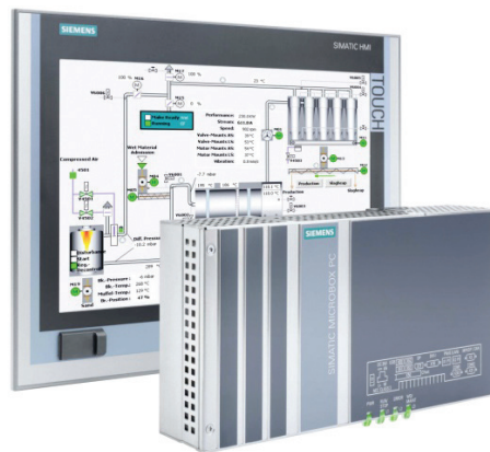
Slika 4 – IPC

IPC je danas prilagođen za standardnu montažu koju je moguće proširivati. Zbog toga što je u suštini IPC-a PC, njegova moć procesiranja i komunikacije i pohrana podataka su bez premca u usporedbi s PLC-om ili PAC-om.