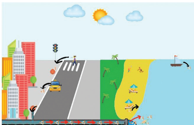
Slika 1 – Načini dospijevanja opušaka u okoliš Fig. 1 – The ways in which cigarette butts enter the environment

osobnog otpada, te odbačene opuške možemo primijetiti na svim javnim površinama, od ulica do plaža i vodnih putova (slika 1). 11 To možemo pripisati porastu broja stanovništva, čime se posljedično povećava i broj pušača. Godišnje se odbaci oko 4,5 bilijuna opušaka u okoliš, jer oko 76 – 84 % pušača odbacuje opuške u okoliš umjesto njihova odlaganja u kante za otpad. 11 Procjena je da će do 2025. godine na svjetskoj razini biti konzumirano devet trilijuna cigareta. 7 Odbačeni opušci pomoću oborina završavaju u odvodu, te tako dolaze do rijeka i oceana, a iz oceana dospijevaju na plaže. 12 Zbog svoje male mase, opušci se prenose i vjetrom te kad dospiju u vodu, plutaju na površini neko vrijeme prije nego što se natope vodom i potonu, što olakšava njihov transport. U proteklih 27 godina prikupljeno je oko 52 milijuna odbačenih opušaka s plaža i obalnih sredina. 7 Opušci su mali u odnosu na ostali antropogeni otpad. Međutim, količina odbačenih opušaka svake se godine povećava te predstavlja velik problem za okoliš, jer kemijske komponente opušaka djeluju toksično na okoliš i ljude. 13