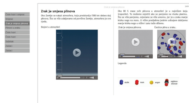
Slika 2 – Primjer stranice u e-jedinici Čiste tvari i smjese

Mrežno potpomognuti materijali za učenje, odnosno nastavne jedinice u e-obliku (e-jedinice), izrađeni su uz pomoć programa eXeCute za četiri nastavne jedinice u sklopu Nastavnog plana i programa kemije za osmi razred devetogodišnje osnovne škole u Federaciji Bosne i Hercegovine (uzrast učenika 13 – 14 godina): Grada tvari , Agregacijska stanja tvari , Čiste tvari i Smjese . Za rad na tim materijalima nije bio potreban pristup internetu, a učenici su datoteku pokretali u programu Google Chrome ® ili Mozilla Firefox ®.