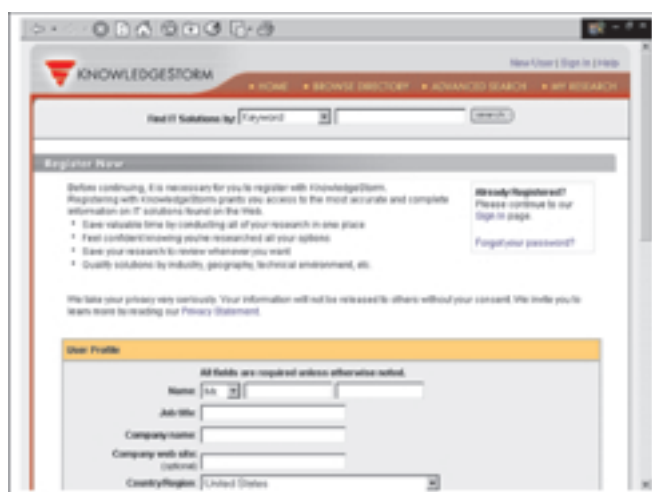
Besplatna registracija korisnika prije dobivanja konačne informacije

Po odabiru proizvoda (aktiviranjem poveznice) pojavljuje se najprije zahtjev za registracijom koja je potpuno besplatna uz uvjeravanja Knowledgestorma kako će ti podaci biti strogo čuvana tajna te ako želite možete i pročitati njihovu politiku čuvanja privatnosti.