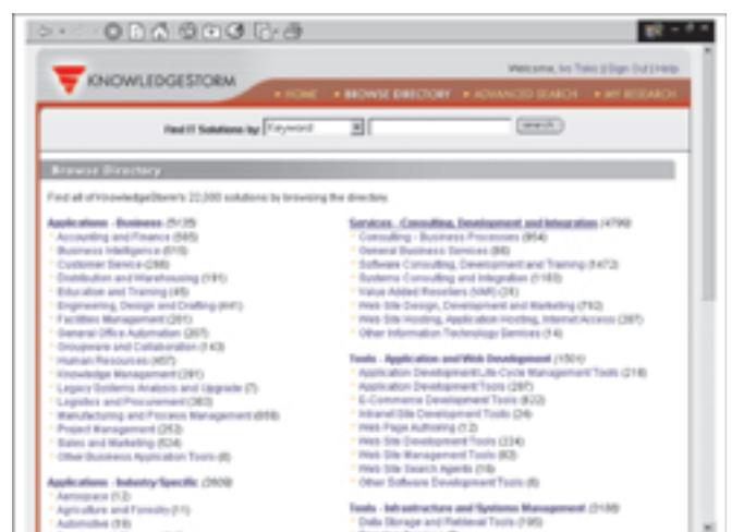
Stranica: Browse directory

Budući da bi nam bilo premalo prostora kada bismo htjeli detaljno opisivati koje sadržaje nude ove bogate i profesionalno odlično uređene stranice, zadržat ćemo se ovom prilikom samo na nekim njihovim zanimljivim karakteristikama te pokazati kako se može doći do informacija potrebnih za izbor i nabavu suvreme-