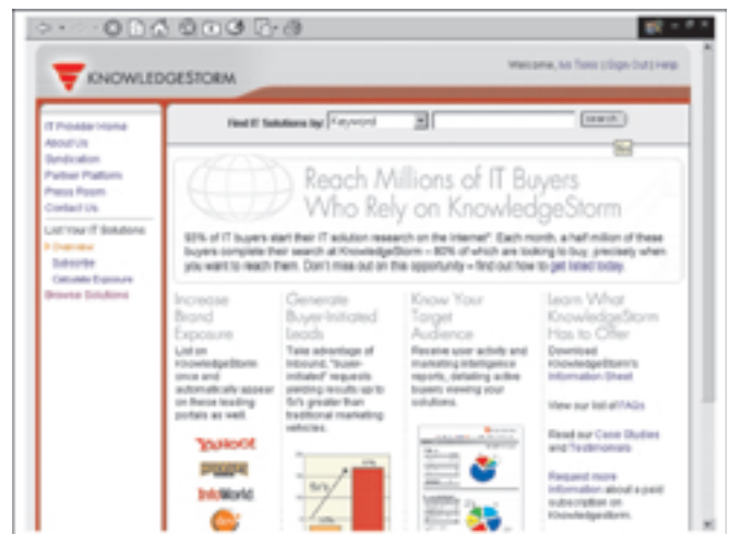
Stranica: Get listed in our directory

Spomenuli smo ranije uputu Get listed in our directory . Ona se ponavlja u donjem dijelu svih stranica, a cilj joj je upozoriti po-