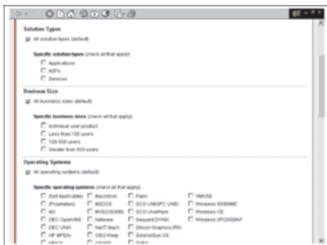
Stranica: Advanced Search (dio)

ali su pred nama) polazimo na Browse directory i tu nalazimo proizvode i usluge razvrstane u skupine Applications-Bussiness (5135), Applications-Industry specific (2609), Services-Consulting, development and integration (4799), itd. Brojevi u zagradama pokazuju broj proizvoda koji se nudi za to područje. Svako se područje dalje grana, pa se tako npr. Industry specific dijeli redom na Aerospace (12), Agriculture and forestry (11), Automotive (19), itd. Aktiviranjem neke poveznice ulazi se u navedeno područje i izabire neki od ponuđenih proizvoda. Kako? Vidjet ćemo ubrzo. Ali ako točno znamo što tražimo ili barem imamo dosta specifične zahtjeve, možemo krenuti preko Advanced Search .