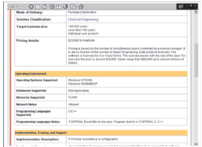
Stranica s informacijama o proizvodu (nastavak)

du, demo, cjenik), i to odmah, ili bi vam samo koristili da se mogu dobiti, ili pak samo "razgledavati" (jasno, potpuno slobodno i bez obaveze).