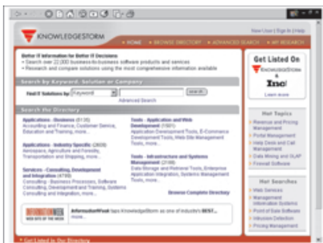
Početna stranica KnowledgeStorma www.knowledgestorm.com

Aktivirajući jednu od tri ponuđene mogućnosti pretraživanja (iako uz tražilicu postoje zapravo četiri, ne računajući izravan odabir poveznica s prve stranice kao peti koji se ne nude naglašeno,