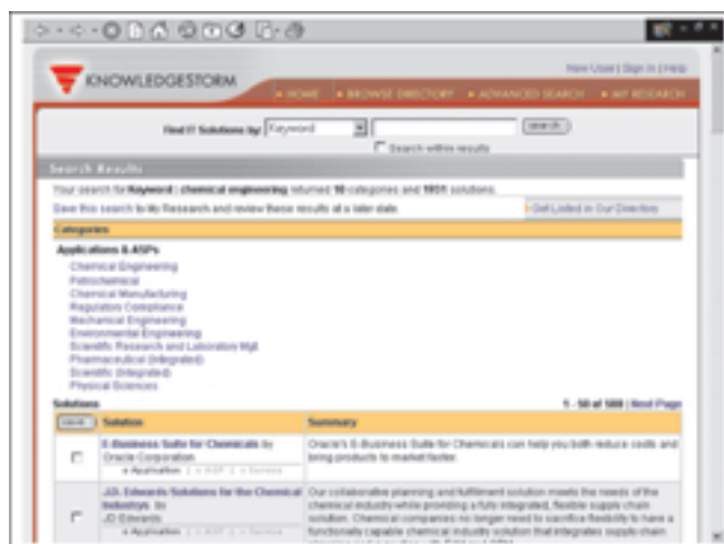
Rezultat pretraživanja prema tražilici, pojam: chemical engineering

Zanimalo nas je što se može naći ako potražimo npr. kemijsko inženjersvo i kako doći do informacije o nekom proizvodu za to područje.