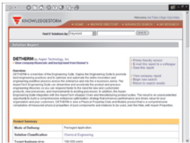
Stranica s informacijama o proizvodu (početak)

tencijalne proizvođače da se pridruže svojim podacima ovoj bazi. Ujedno i korisnike (koji su i posjetitelji pri kupovini i sami proizvođači) ovog servisa upućuju na mogućnost višestrukog iskorištavanja niza podataka koji se na ovim stranicama mogu naći. Aktiviranjem ove poveznice otvara se sljedeća stranica: