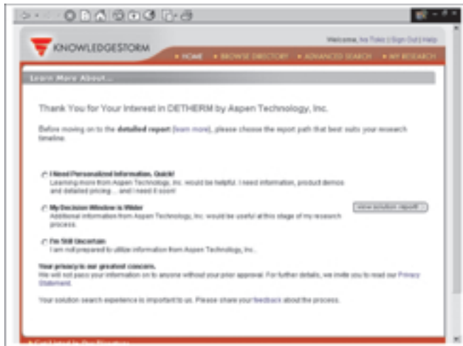
Iskazivanje statusa korisničkih potreba u vezi informacija o proizvodu