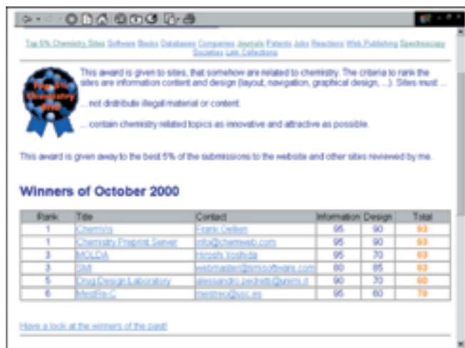
Izbor najboljih kemijskih mjesta na internetu Top 5% Chemistry sites

Iza linka Journals nalazi se po abecednom redu složeno više od 650 online verzija znanstvenih i stručnih časopisa različitih izdavača koji redom pripadaju u skupinu najkvalitetnijih časopisa iz