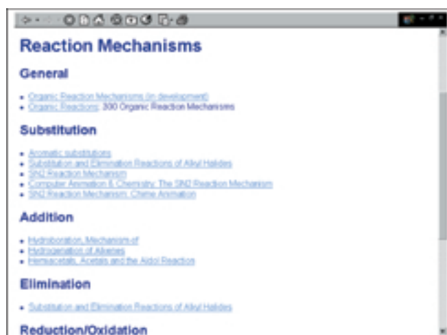
Stranica Reaction Mechanisms

Na stranici Databases donose se tri istaknute baze podataka: UnCover s pretražljivim podacima iz više od 15000 časopisa od 1988. naovamo prema autorima, ključnim riječima i sl.; ponovno se na ovom mjestu susrećemo s bazom Chemfinder te Free Medline. Osim ovih baza nalaze se linkovi na još 105 baza podataka.