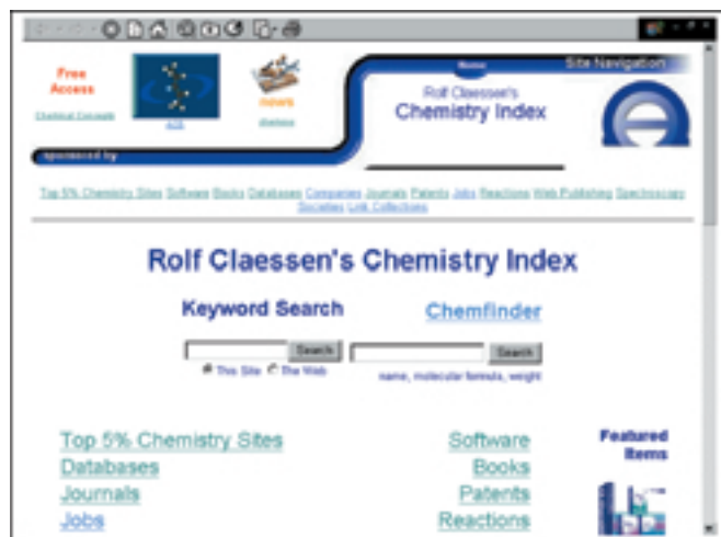
Početna stranica Rolf Claessen's Chemistry Indexa

Na web adresi www.claessen.net/chemistry/ nalazi se iznimno zanimljivo mjesto na internetu koje pregledno i informativno donosi niz raznovrsnih podataka s područja kemije. Na suvremeno dizajniranoj početnoj stranici ističu se dvije tražilice i dominantnih 13 početnih linkova. Prva je tražilica za ključne riječi kojima se pretražuje ili cijeli internet ili samo ovo mjesto na internetu. Druga je tražilica ona Chemfindera kojom se pretražuju imena tvari, njihove molekulske formule, težine. Linkovi koji dominiraju početnom stranicom upućuju redom na najbolja kemijska mjesta na internetu, baze podataka, časopise, zaposlenja, izdavanje na internetu, udruge, software, knjige, patente, kemijske reakcije, spektroskopiju, razne indekse i kemijske tvrtke.