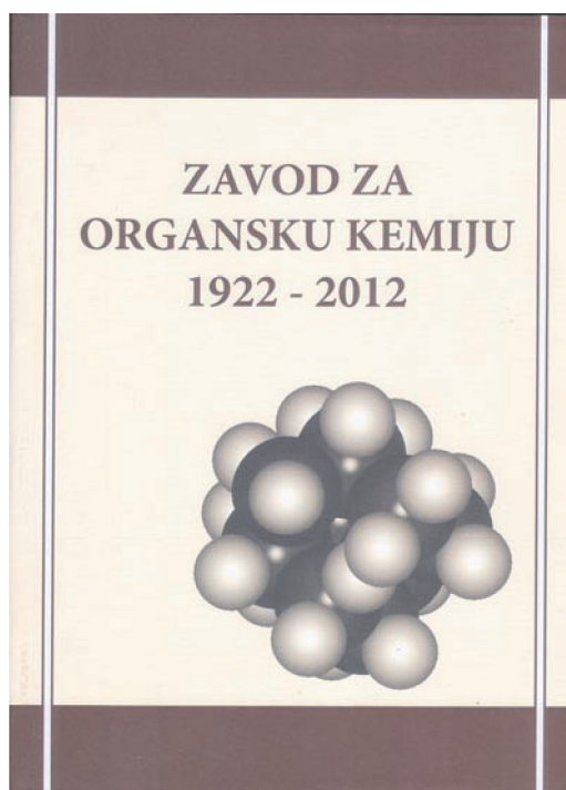
Slika 1 – Prva stranica monografije Zavod za organsku kemiju 1922 – 2012

Zatim je prof. Škorić pozvala bivše i sadašnje članove Zavoda da se u neposrednom i nekonvencionalnom tonu obrate svim prisutnima. Kao najstariji živući i bivši član Zavoda prvi se odazvao