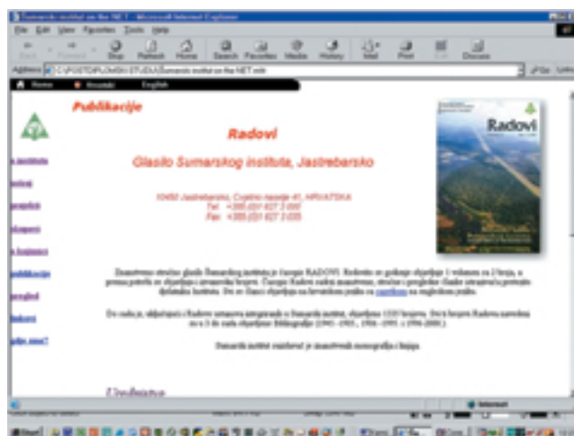
Web stranica ŠI – publikacije

Osnivanjem Zavoda za četinjače otpočelo je sustavno prikupljanje knjižne građe i osnovana je specijalna knjižnica u sklopu Zavoda. S početkom izdavanja časopisa RADOVI , 1966. godine, i njegovim distribuiranjem srodnim ustanovama u zemlji i svijetu, počinje i razmjena Radova za druge časopise. Uz razgranatu suradnju naših znanstvenika sa znanstvenicima diljem svijeta, koja je rezultirala mnogim donacijama, i razmjena je obogatila fond knjižnice. Tijekom godina izdvajana su znatna sredstva za nabavu knjiga i časopisa i stvorena je vrijedna knjižnična zbirka iz područja šumarstva, botanike, klimatologije, geologije i kemije.