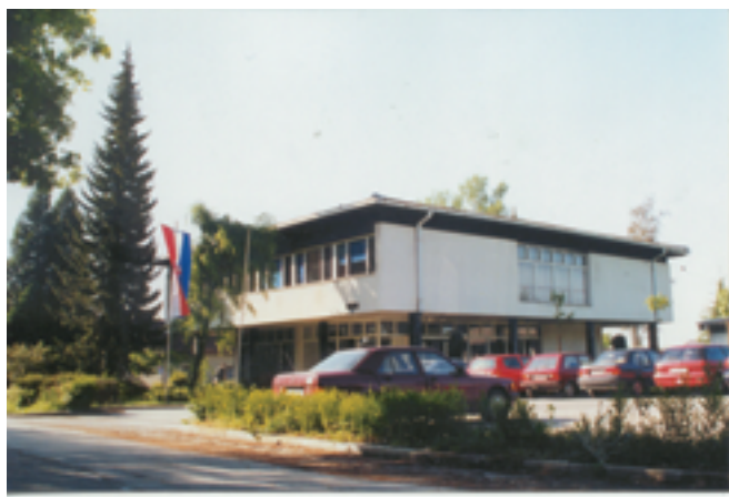
Šumarski institut, Jastrebarsko

Knjižnica danas posjeduje oko 6000 svezaka knjiga i oko 250 naslova časopisa, zbirku standardne referentne literature i zbirku magistarskih i doktorskih radova. Kao specijalna knjižnica otvorenog tipa, Knjižnica je ponajprije namijenjena djelatnicima Insti-