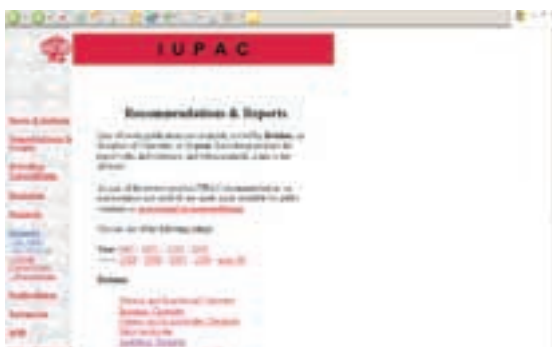
Recommendations &amp; Reports

Recommendations & Reports donose popis recentnih publikacija razvrstanih prema području kemije ili godini – i to po pojedinim godinama od 2003. do 1996. te skupno sva izvješća i preporuke prije 1996. Odabirom nekog područja kemije dobivamo reference preporuka i izvješća za to područje s nužnim podacima o naslovu i publikaciji u kojoj je objavljen (najčešće časopis Pure and Applied Chemistry ). Aktiviranjem poveznice dolazi se do detaljnih podataka o dokumentu kao i do njegovog sažetka.