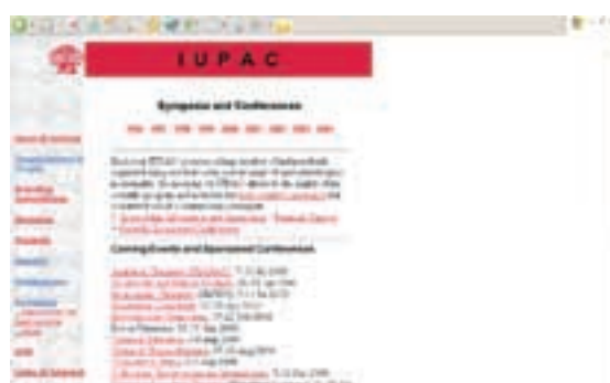
Symposia and Conferences

Symposia and Conferences donose popis stručnih i znanstvenih skupova koje sponzorira IUPAC. Sponzoriranje u ovom slučaju znači potvrdu kvalitete znanstvenog programa skupa i ukazuje