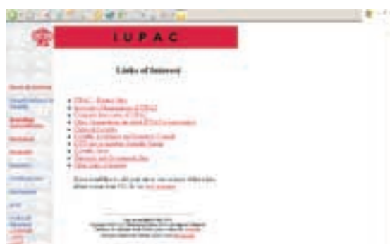
Links of Interest

Treba spomenuti da se na ovom mjestu donose i poveznice na odgovarajuće kalendare skupova koje referira International Council for Science te na ACS Calendar , RSC Education Calendar i ChemSoc Conferences & Events database .