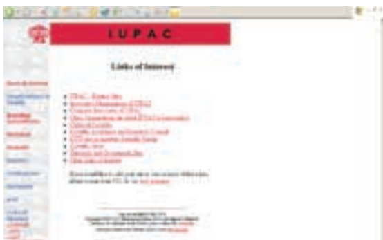
IUPAC – početna stranica www.iupac.org

Došavši na web stranicu tako značajne organizacije, moramo najprije uočiti preglednost i jasnoću stranice. To može zavarati budući da nema pretrpanosti sadržaja na prvoj stranici, što je karakteristično za danas popularnu portalsku organizaciju stranica na internetu te se u prvi mah može učiniti kako se na ovom mjestu i ne nudi obilje informacija. No radi se samo o odličnoj organizaciji sadržaja i njegovom predstavljanju na ovom mjestu na internetu kako i priliči svjetski najznačajnijoj kemičarskoj organizaciji. Mi se stoga u ovom pregledu niti nećemo dotaknuti baš svih ponuđenih sadržaja već ćemo napraviti izbor sadržaja koji bi mogao biti zanimljiv širem krugu stručnjaka.