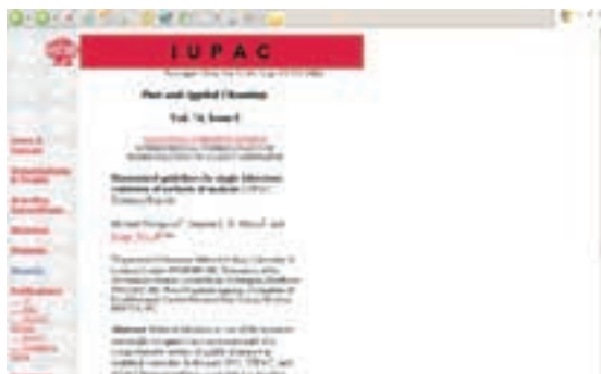
Recent Reports - pojedinačni dokument s podacima i sažetkom

na spremnost zemlje domaćina da osigura sudjelovanje u radu skupa znanstvenicima iz bilo koje zemlje svijeta. Skupovi se mogu pretraživati po godinama od 2004. do 1996.