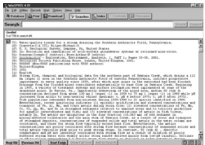
Slika 7 – All fields