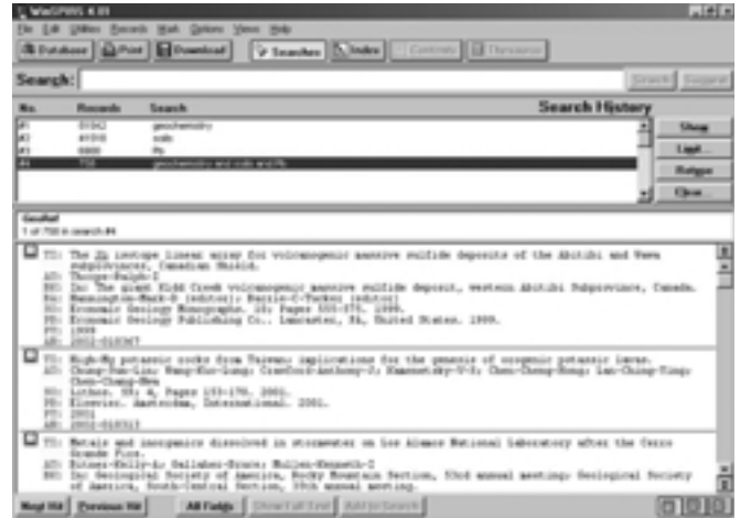
Slika 5 – Search History

Upisivanjem ključnih riječi u prozor Search, dobije se prozor Search History (slika 5). Kako je već spomenuto u poglavlju o samom programu WinSPIRS, da se reducira broj pronađenih zapisa, mogu se koristiti booleovi operatori te simboli truncation i wildcard .