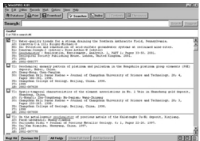
Slika 6 – Brief fields

Kada smo dobili rezultate pretraživanja, bilo iz indeksa bilo iz pretraživanja pomoću ključnih riječi, možemo birati broj prikazanih polja. Brief fields (slika 6) nudi samo naslov, autore, izvor, urednika, ključne riječi, izdavača, godinu izdanja i broj u bazi GeoRef, dok postoji mogućnost i prikaza svih polja ( All fields – slika 7) jezik publikacije, abstrakt, proširene ključne riječi, ima li ilustracija, slika, grafova te ISBN ili ISSN.