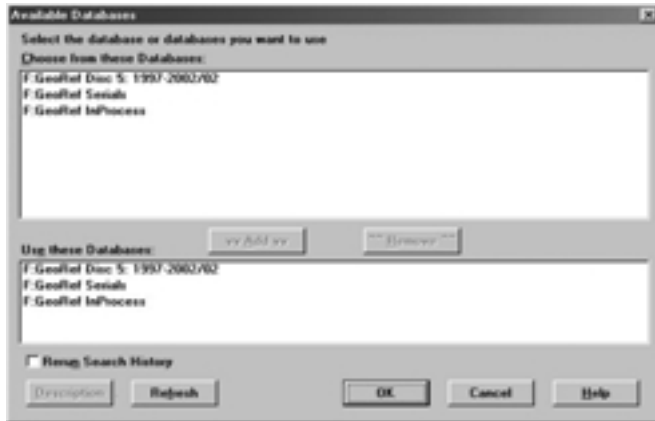
Slika 1 – Dostupne baze podataka