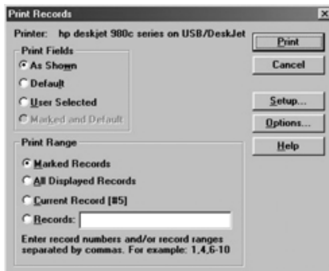
Slika 9 – Ispis podataka

Kod ispisa se također mogu birati način ispisa zapisa: označeni zapisi, svi prikazani zapisi, tekući zapisi (do 5) ili određeni zapisi (slika 9).