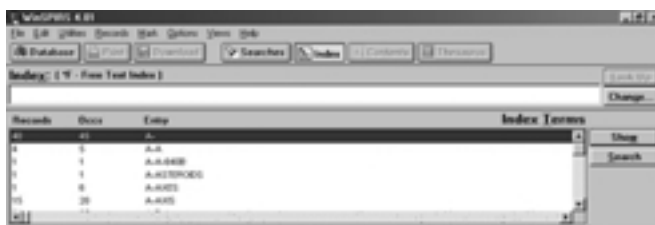
Slika 4 – Index opcija pretraživanja

Odabirom opcije Index dobije se popis indeksnih pojmova (slika 4) koji se mogu pregledavati pomicanjem gore dolje po indeksu pojmova ili upisivanjem željenog pojma. Nakon odabira željenog pojma klikom na tipku Show pokazuju se željeni rezultati.